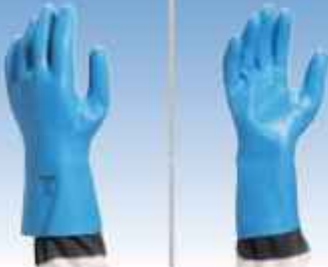
ACEPI® GANTS VENISETTE 7 1/2 Réf : SECU VE 9207 / 7.1/2 GANTS VENISETTE 9 1/2 Réf : SECU VE 9207 / 7.1/2