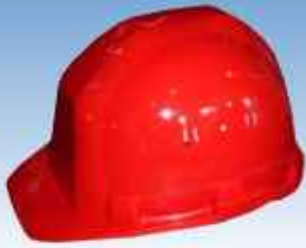
ACEPI® CASQUE CHANTIER Réf : SECU RV 40 R