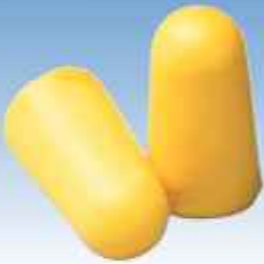
ACEPI® BOUCHONS ANTI-BRUIITS x 200 Réf : SECU CON I CO