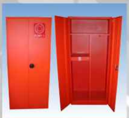
ACEPI® ARMOIRE DE SECURITE EPI Réf : 343 SP