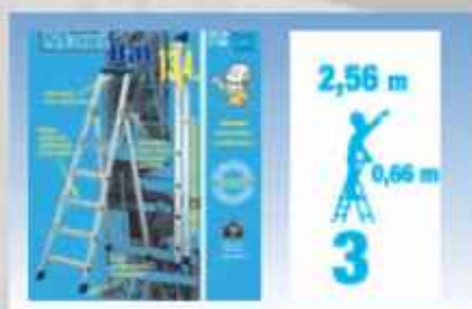
ACEPI® MARCHÉ PIEDS 3 MARCHES Réf : MAXIBAT 20309-3