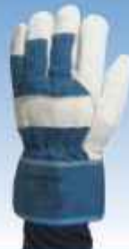
ACEPI® GANTS DE MANUTENTION Réf : SECU GDB 505