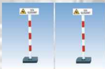
ACEPI® Panneau " SOL GLISSANT " Réf : SECU 2000819