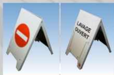
ACEPI® STOP TROTTOIR LESTE Réf : STOP T