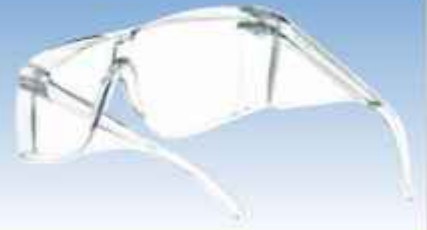
ACEPI® SUR LUNETTE Réf : SECU BOL 1042