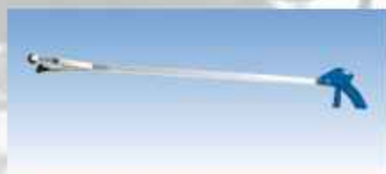
ACEPI® PINCES A DETRITUS Réf : SECU 14140