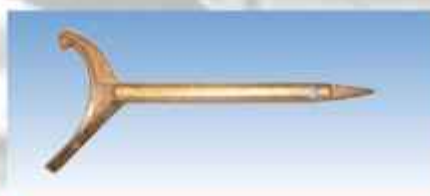
ACEPI® CLE TRIQUOISE PETROLIER Réf : SECU 2016