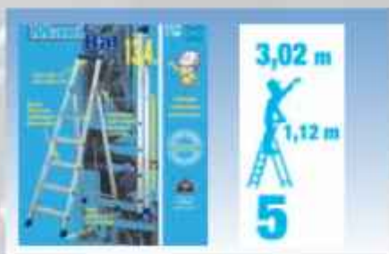
ACEPI® MARCHÉ PIEDS 5 MARCHES Réf : MAXIBAT 20309-5