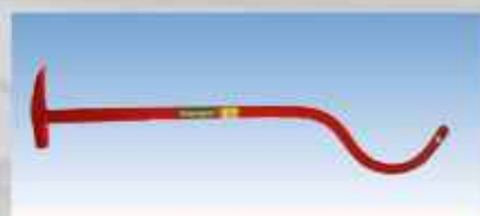
ACEPI® MARTEAU D'EGOUTIER Réf : SECU 35031