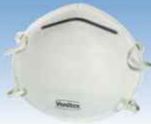
ACEPI® MASQUE ANTI-POUSSIERES Réf : SECU FFP 1, M